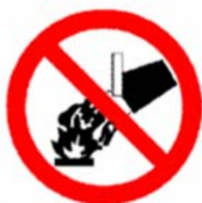
Divieto di spegnere con acqua