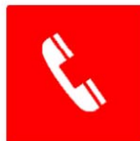
Telefono per gli interventi antincendio