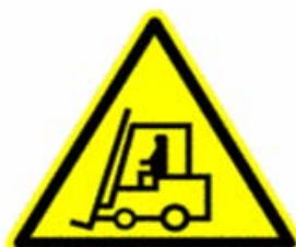
Carrelli di movimentazione