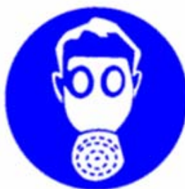
Protezione obbligatoria delle vie respiratorie