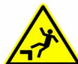
Caduta con dislivello