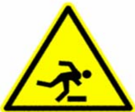
Pericolo di inciampo