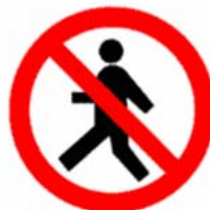
Vietato ai pedoni