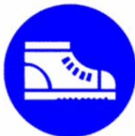
Calzature di sicurezza obbligatorie