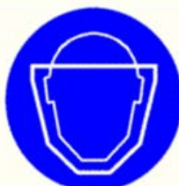
Protezione obbligatoria del viso