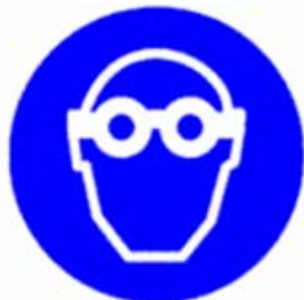
Protezione obbligatoria degli occhi