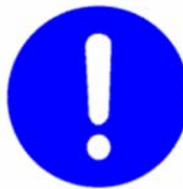
Obbligo generico (con eventuale cartello supplementare)