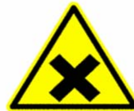
Sostanze nocive o irritanti