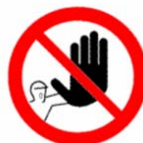
Divieto di accesso alle persone non autorizzate