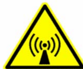
Radiazioni non ionizzanti