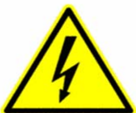
Tensione elettrica pericolosa