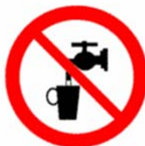
Acqua non potabile