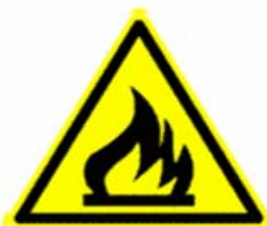
Materiale infiammabile o alta temperatura