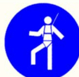
Protezione individuale obbligatoria contro le cadute