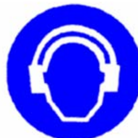
Protezione obbligatoria dell'udito