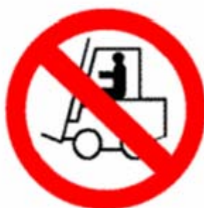
Vietato ai carrelli in movimentazione