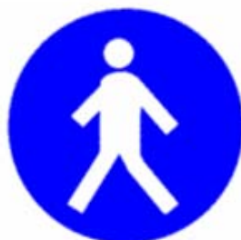
Passaggio obbligatorio per i pedoni