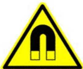
Campo magnetico intenso