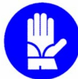
Guanti di protezione obbligatoria