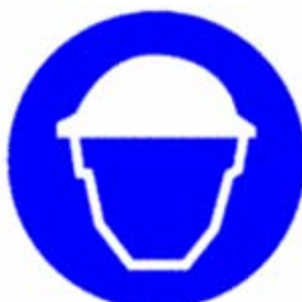
Casco di protezione obbligatorio