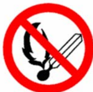
Vietato fumare o usare fiamme libere