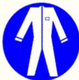
Protezione obbligatoria del corpo